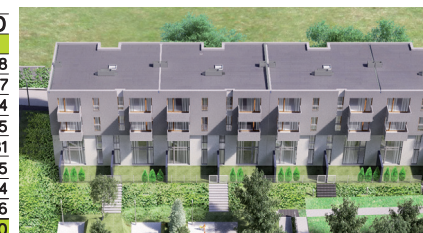
OSIEDLE SZAFIOWE, SUCHY LAS

BUDYNEK MIESZKALNY WIELORODZINNY Z GARAŻAMI